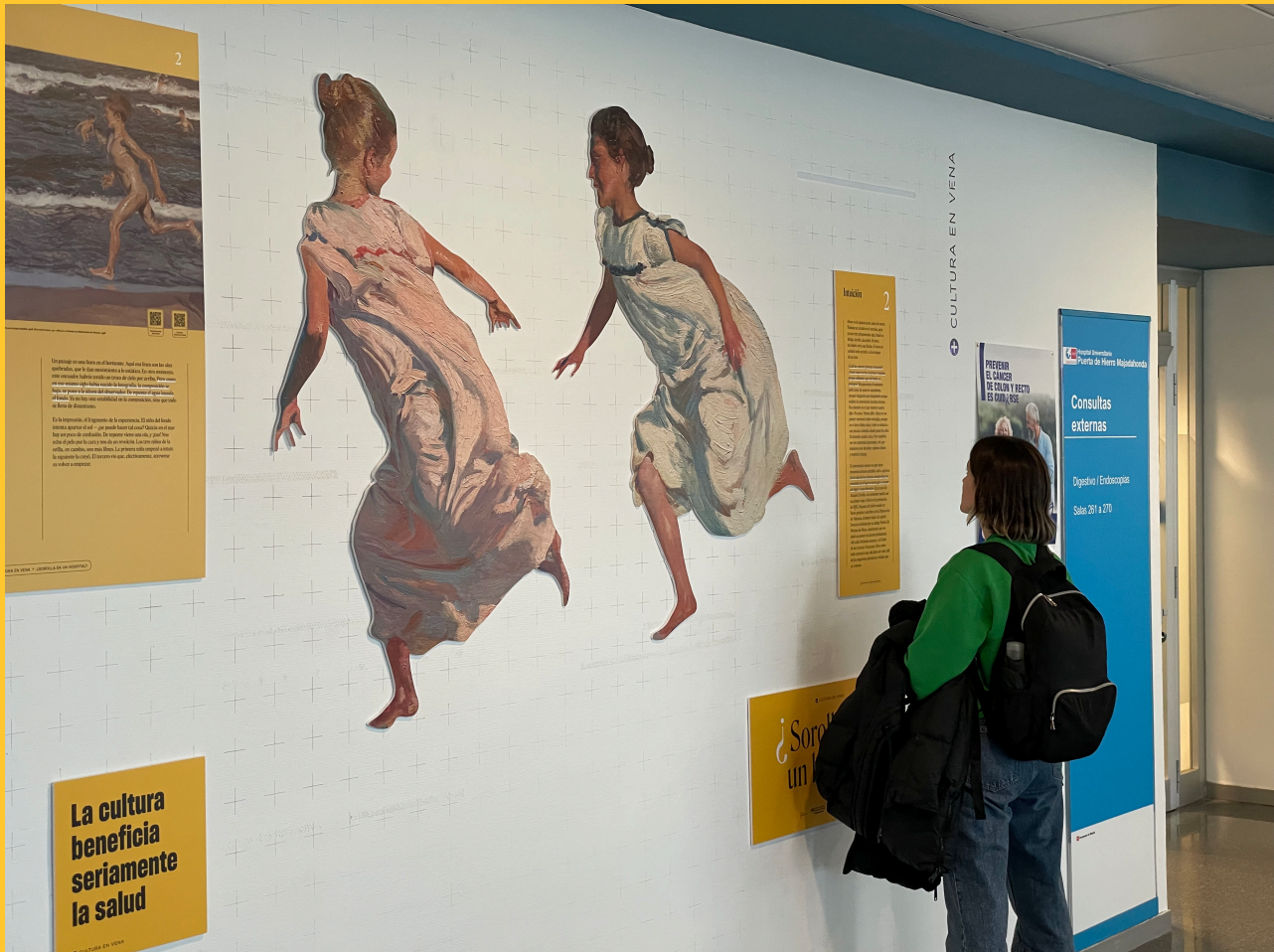
Programa Arte Ambulatorio, exposición ¿Sorolla en un hospital? Hospital Puerta de Hierro Majadahonda, 2023