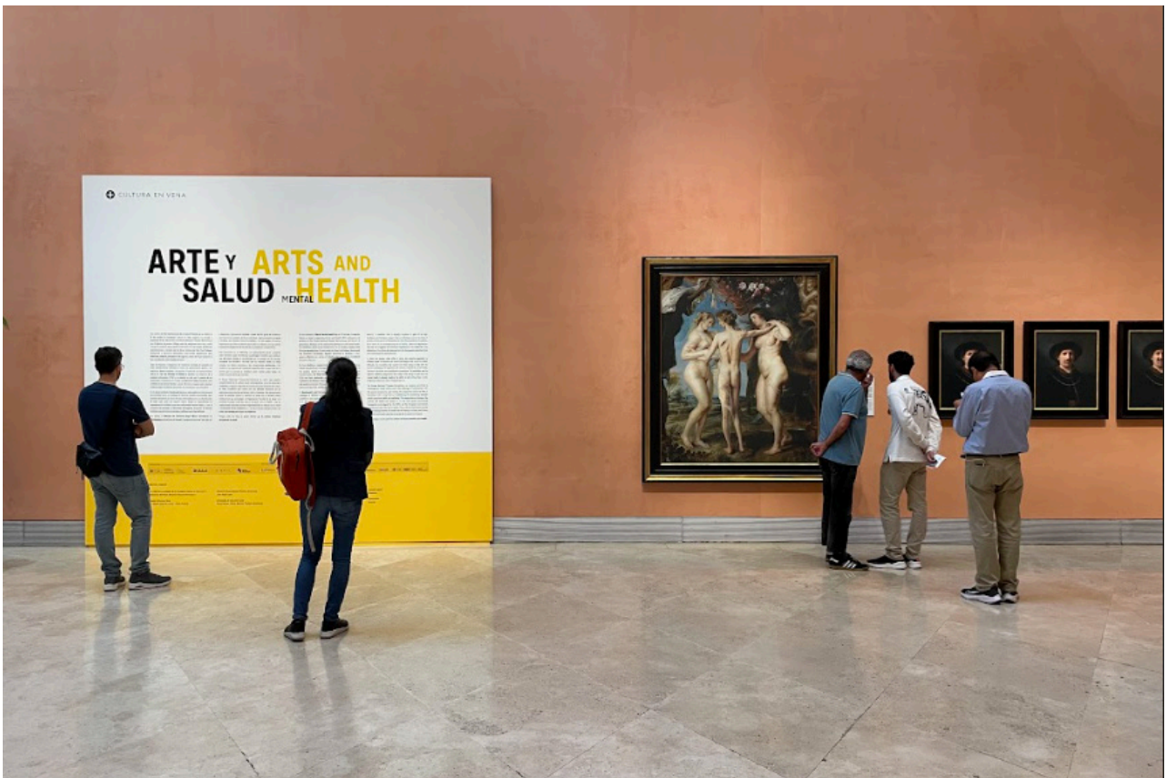
Exposición Arte y Salud Mental. Museo Nacional Thyssen-Bornemisza, 2023